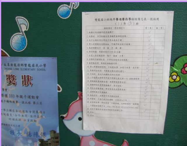
教室張貼「午餐進餐指導檢核備忘表」